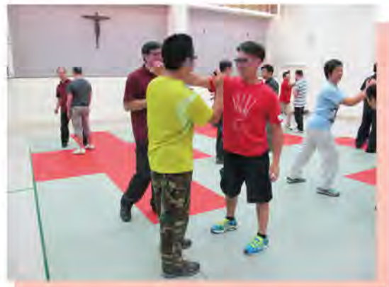
暴力脫身法導師培訓課程

本服務邀請經驗豐富的員工成為內部專家，在不同主題的優質服務實踐分享會中分享他們寶貴的知識和經驗。題目包括危機介入及解說、性教育及治療童年性創傷等。