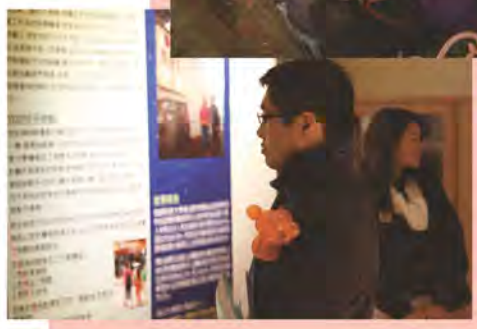
嘉賓正閱覽介紹中心歷史之展板

最後的慶祝活動是假「明愛向晴軒家庭危機支援中心」內舉行之盆菜晚宴及介紹中心的展覽會。該中心為一歷史建築物，曾用作「英國皇家空軍基地大樓」及「越南難民營」。