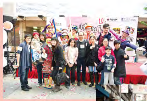
大家齊來拍照，留個美好回憶吧！

接著的慶祝活動為「再晴計劃」於2011年12月17日舉辦之「快樂一加一」互動聖誕派對，內容包括表演及列隊操。