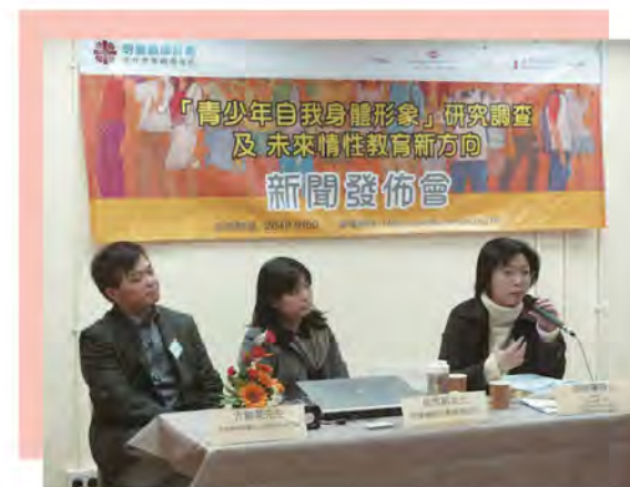
公布研究結果之新聞發布會