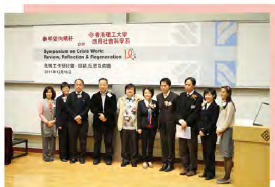
眾嘉賓及講者於研討會開幕禮後合照

明愛向晴軒為香港首間家庭危機支援中心，於2001年起提供服務。為慶祝服務10週年，中心舉辦了一連串的活動。首個活動為2011年12月16日與香港理工大學應用社會科學系合辦的研討會，名為「危機工作研討會：回顧、反思及前瞻」。當日危機工作的專家聚首一堂，分享專業知識及經驗，參加者達150人，反應熱烈。